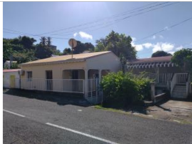
Vue depuis la route