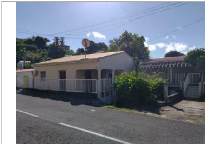
Vue depuis la route

Coordonnées WGS84 : X: -61.69325160 / Y: 15.95037880