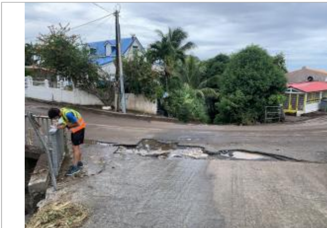
Destruction de l'ouvrage aval