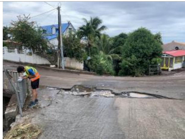
Destruction de l'ouvrage aval