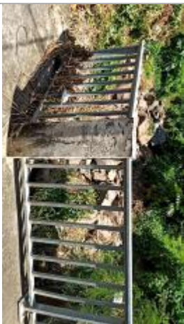
Vue vers l'amont, depuis la rue mercier