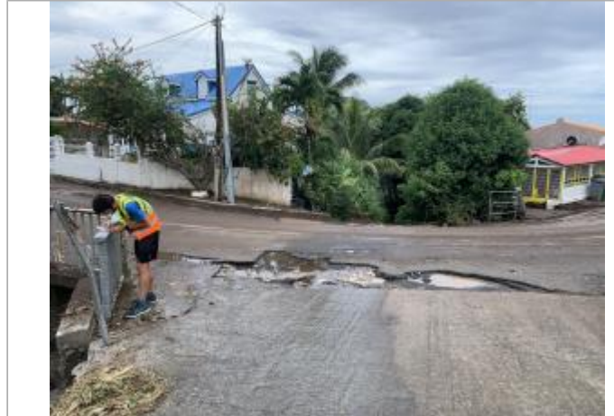
Destruction de l'ouvrage aval