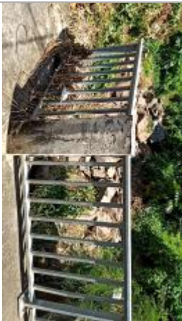
Vue vers l'amont, depuis la rue mercier