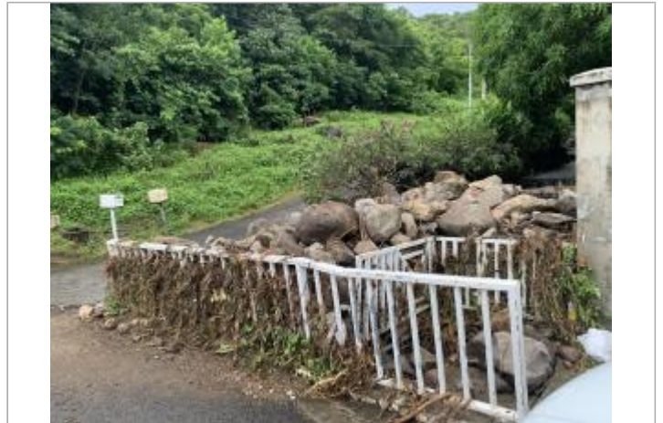
Charriage important sur l'ouvrage