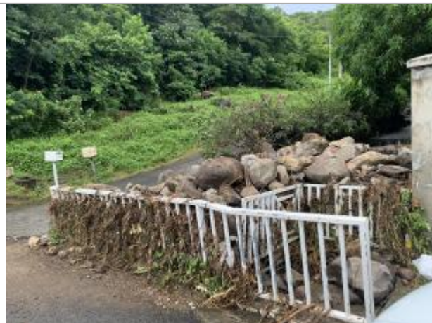
Charriage important sur l'ouvrage