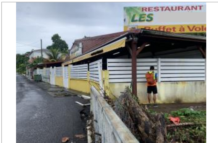
Restaurant côté ravine