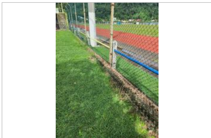
Dépôt de matière solide sur le grillage