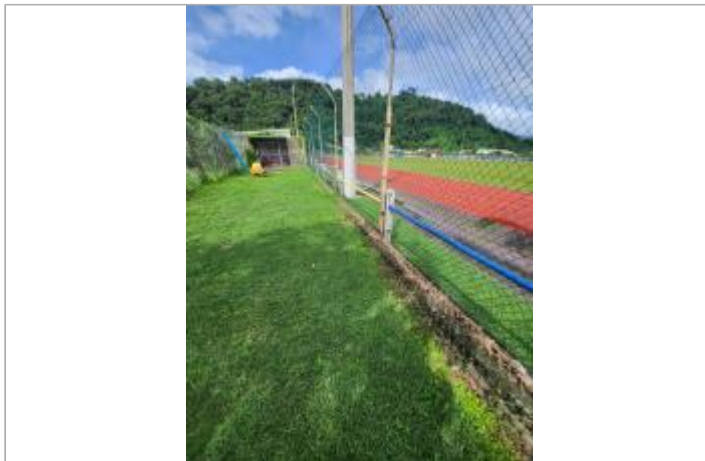
dépôt solide contre le grillage