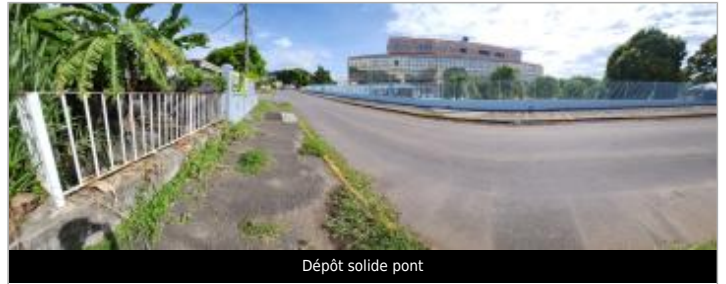
Dépôt solide pont