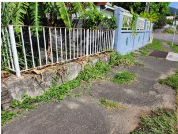
Dépôts matières solides et pont en charge