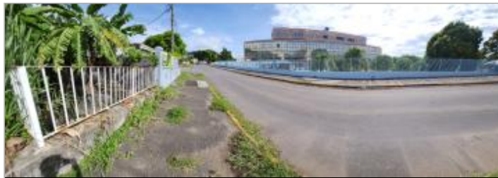
Dépôt solide pont