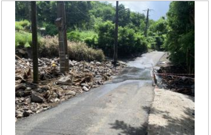
Charriage important au niveau du gué