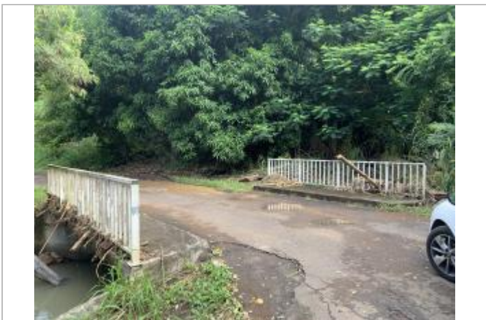
Pont en charge

GÉOLOCALISATION Coordonnées WGS84 : X: -61.70672130 / Y: 15.98595480 (RRAF 91)UTM 20N X: 638389.62 / Y: 1767811.97 Coordonnées RGF93 (ETRS89) : X: -61.7067213 / Y: 15.9859548