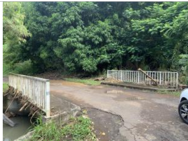
Pont en charge