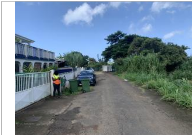
Vue extérieure de la propriété

Coordonnées WGS84 : X: -61.70941830 / Y: 15.98546640