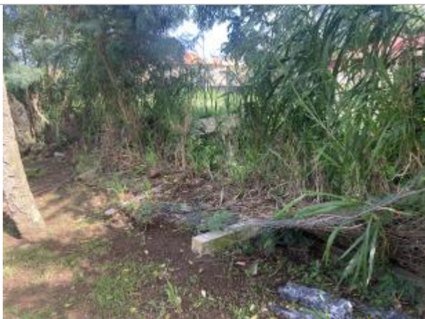
Applatissement de la barrière