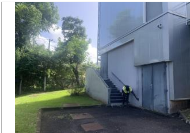
Arrière du bâtiment, à proximité de la ravine Blanche