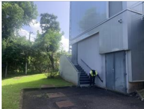
Arrière du bâtiment, à proximité de la ravine Blanche