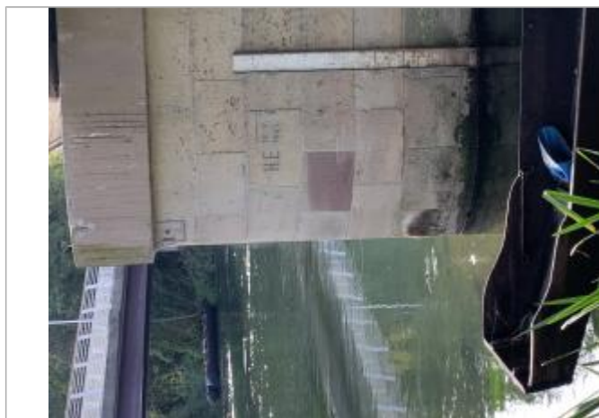
Rive gauche - première pile