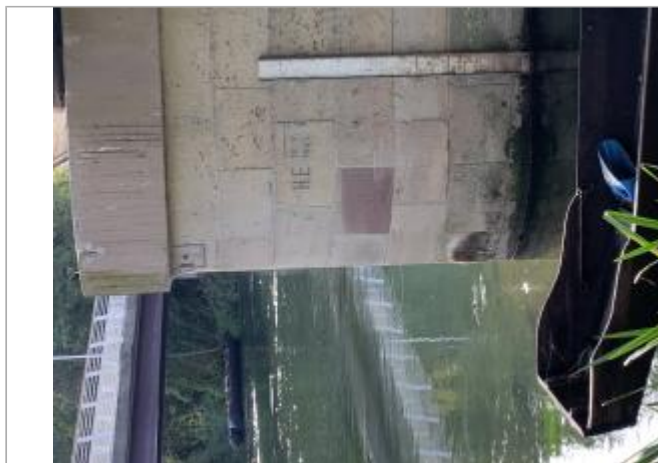
Pile en RG aval