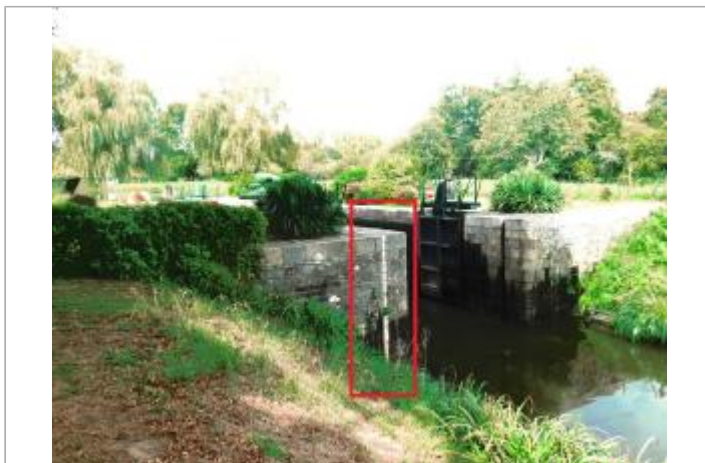
Aval de l'écluse de Beaumont à Saint-Congard