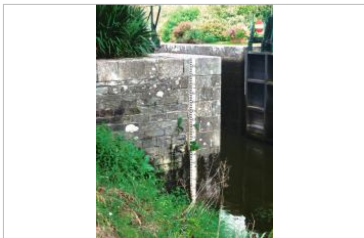
Echelle aval de l'écluse de Beaumont à Saint-Congard

Altitude calculée de l'eau (en m) : 10.949 m