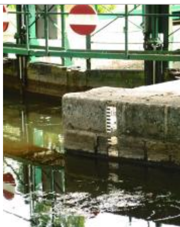
Echelle amont de l'écluse de Beaumont à Saint-Congard

Altitude calculée de l'eau (en m) : 11.634