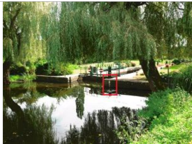
Amont de l'écluse de Beaumont à Saint-Congard