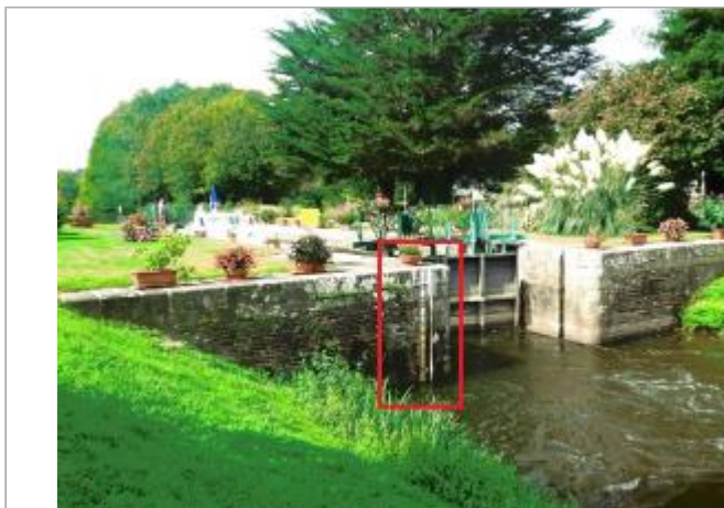
Ecluse de Foveno aval à Saint-Congard