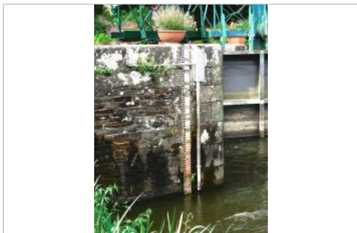
Echelle aval de l'écluse de Foveno à Saint-Congard