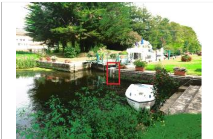
Amont de l'écluse de Foveno à Saint-Congard