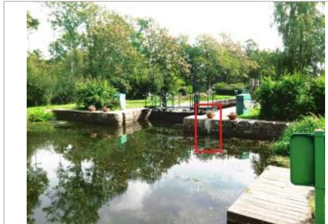
Ecluse de la Née (Métairie) amont à Saint-Marcel

Coordonnées WGS84 : X: -2.39915592 / Y: 47.82461690