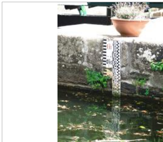
Echelle amont de l'écluse de La Née à Saint-Marcel