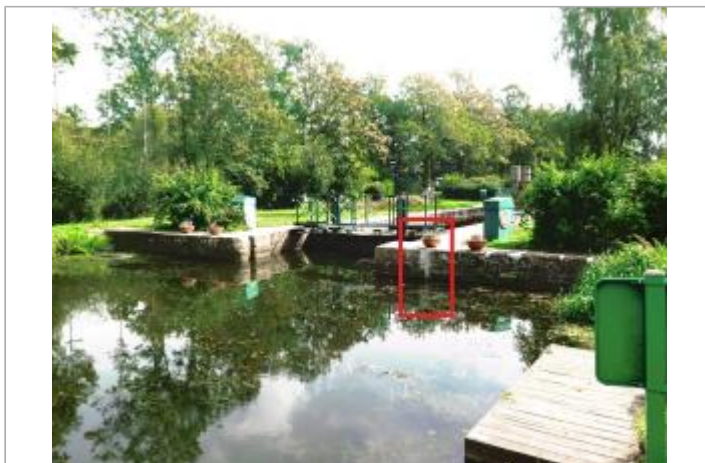
Ecluse de la Née (Métairie) amont à Saint-Marcel