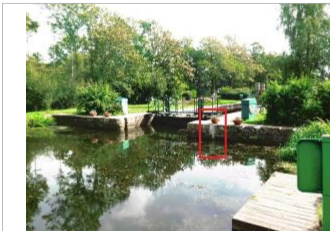
Ecluse de la Née (Métairie) amont à Saint-Marcel