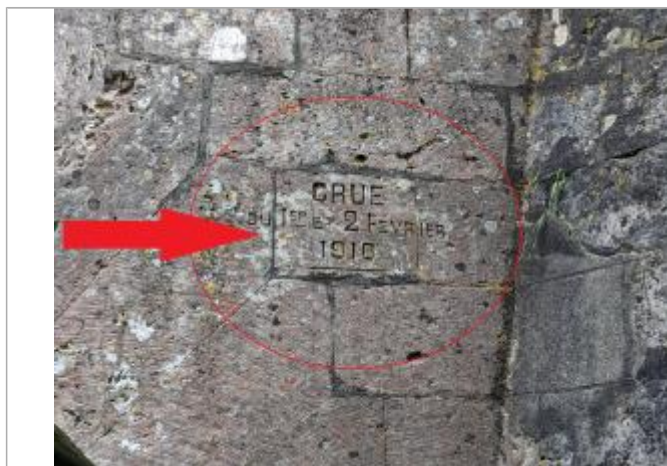
Vue de la marque gravée.

Altitude calculée de l'eau (en m) : 8.97 m