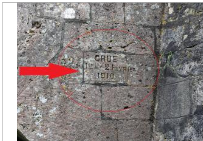
Vue de la marque gravée.

Altitude calculée de l'eau (en m) : 8.97 m