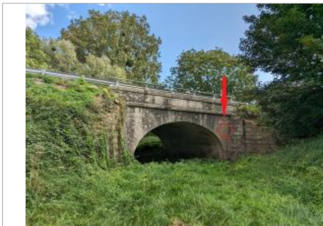
Vue du site coté aval du pont.