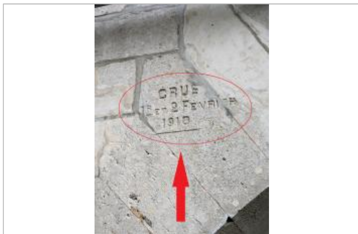
Vue de la marque gravée sur l'arche du pont.

Altitude calculée de l'eau (en m) : 8.98 m