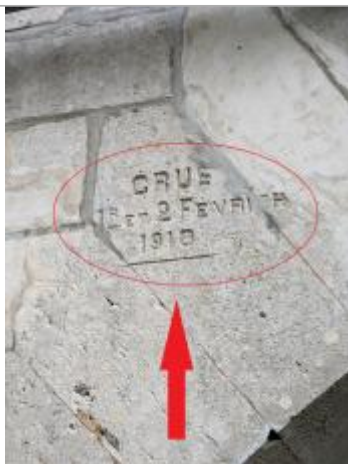
Vue de la marque gravée sur l'arche du pont.