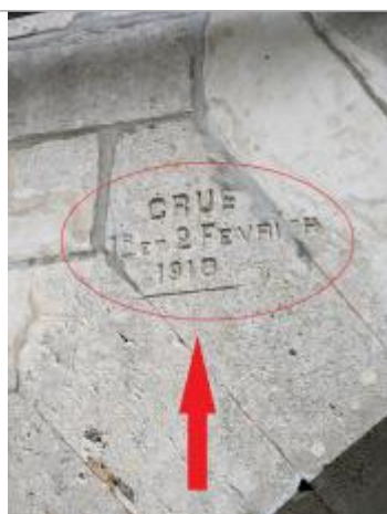
Vue de la marque gravée sur l'arche du pont.

Altitude calculée de l'eau (en m) : 8.98 m