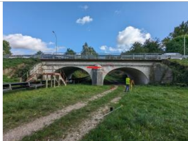
Vue du pont, en bas depuis le coté aval.