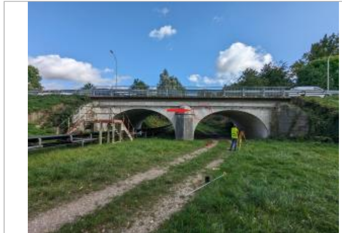
Vue du pont, en bas depuis le coté aval.