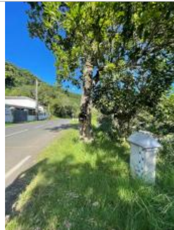
Vue générale du site, DEAL Réunion, 2023