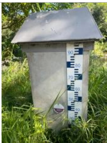
Vue rapprochée du repère, DEAL Réunion, 2023

Altitude calculée de l'eau (en m) : 76.16 m