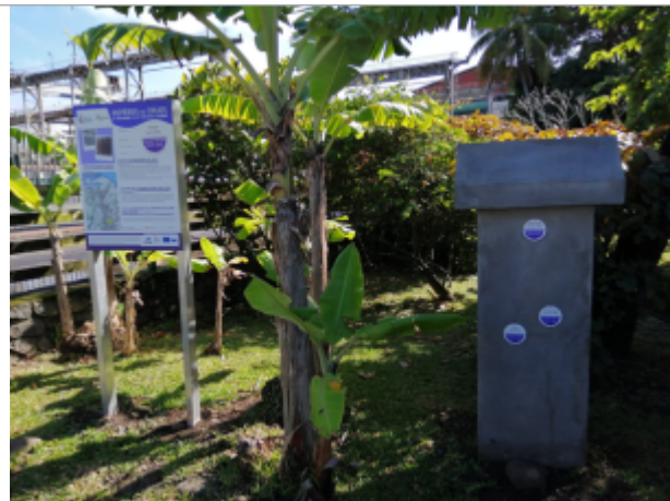
Vue générale du site, DEAL Réunion, 2023

Coordonnées WGS84 : X: 55.63751210 / Y: -20.93422500