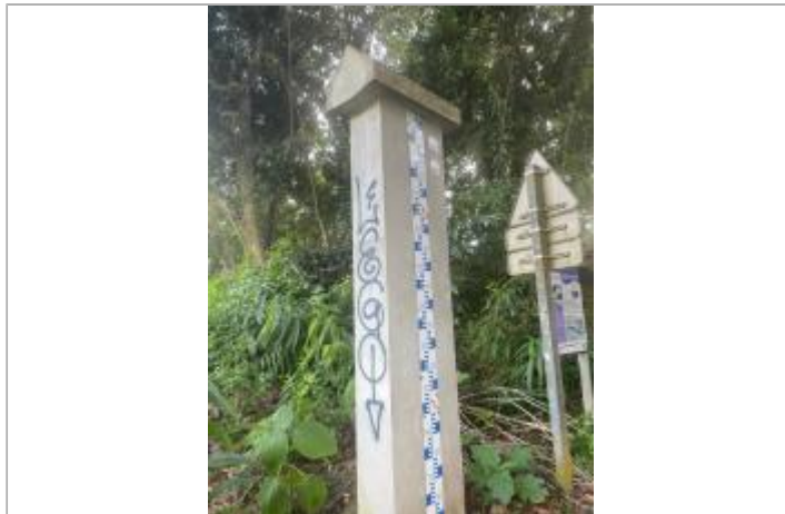
Vue générale du site, DEAL Réunion, 2022