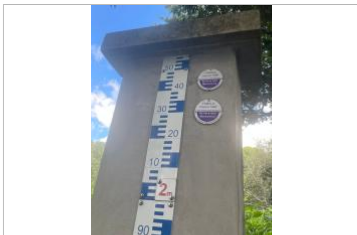
Vue rapprochée du repère, DEAL Réunion, 2023

Altitude calculée de l'eau (en m) : 47.1 m