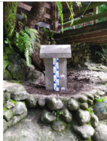
Vue générale du site, DEAL Réunion, 2023