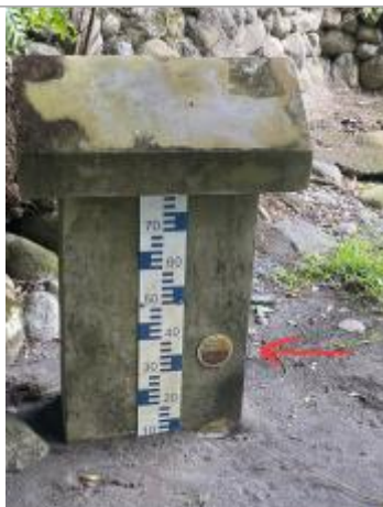
Vue rapprochée du repère, DEAL Réunion, 2023

Altitude calculée de l'eau (en m) : 46.5 m