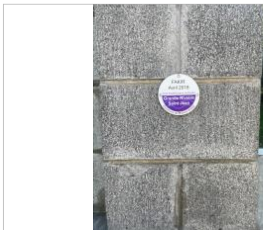
Vue rapprochée du repère, DEAL Réunion, 2023