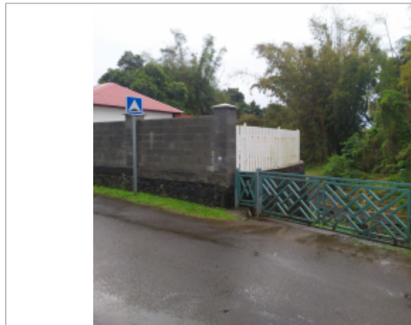
Vue générale du site, DEAL Réunion, 2023