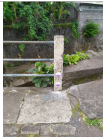
Vue générale du site, DEAL Réunion, 2023