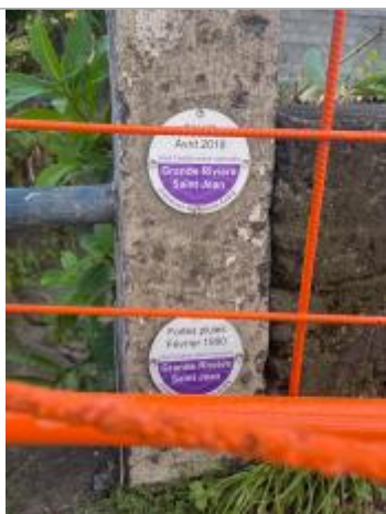
Vue rapprochée du repère, DEAL Réunion, 2023

Altitude calculée de l'eau (en m) : 75.4 m