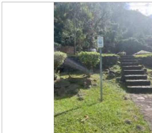
Vue rapprochée du repère, DEAL Réunion, 2023