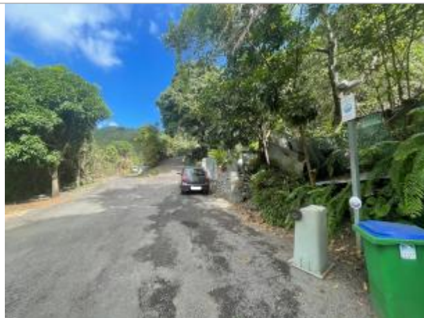
Vue générale du site, DEAL Réunion, 2023