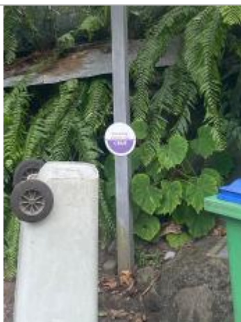
Vue rapprochée du repère, DEAL Réunion, 2023