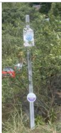
Vue rapprochée du repère, DEAL Réunion, 2023