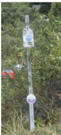
Vue rapprochée du repère, DEAL Réunion, 2023