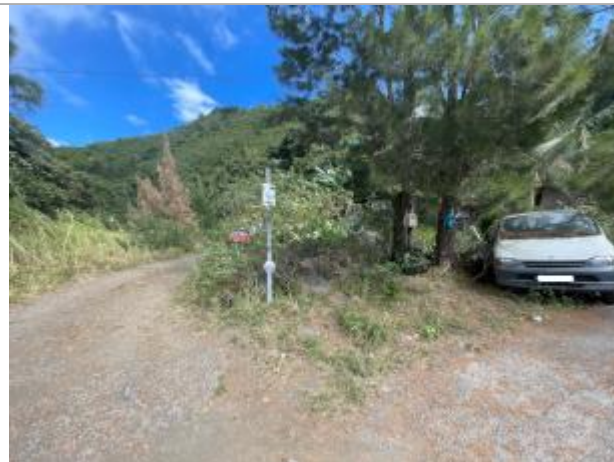
Vue générale du site, DEAL Réunion, 2023