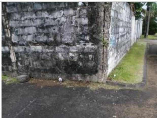
Vue rapprochée du repère, DEAL Réunion, 2023

SOURCE DE REPÉRAGE : RECENSEMENT DE REPÈRES DE CRUES PAR LA DEAL RÉUNION - 04/07/2023