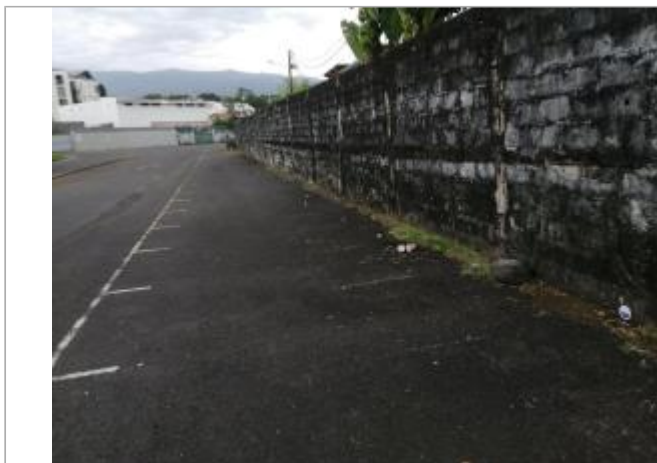
Vue générale du site, DEAL Réunion, 2023

Coordonnées WGS84 : X: 55.71672130 / Y: -21.03449300