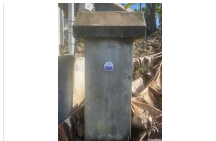
Vue rapprochée du repère, DEAL Réunion, 2023