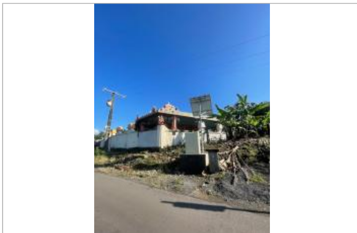
Vue générale du site, DEAL Réunion, 2023

Coordonnées WGS84 : X: 55.64028500 / Y: -20.93521100