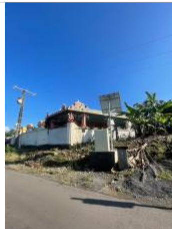
Vue générale du site, DEAL Réunion, 2023