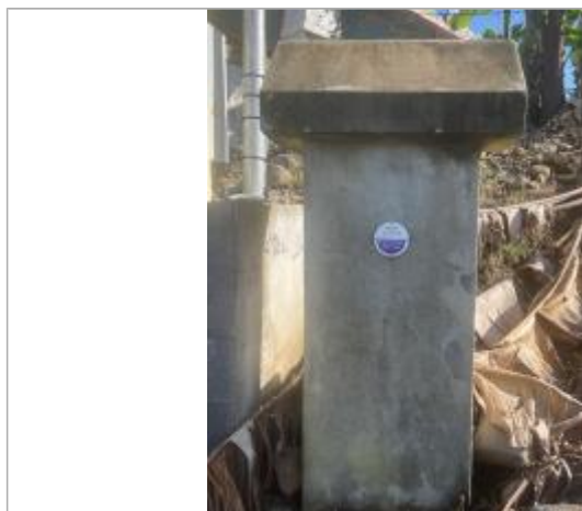
Vue rapprochée du repère, DEAL Réunion, 2023

Texte : Fakir avril 2018 Grande Rivière Saint Jean