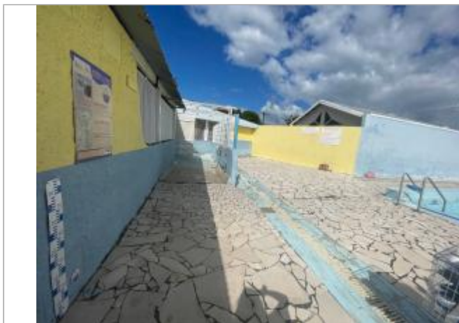
Vue générale du site, DEAL Réunion, 2023