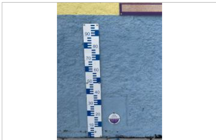
Vue rapprochée du repère, DEAL Réunion, 2023

Altitude calculée de l'eau (en m) : 82.56