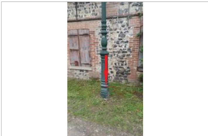
Vue de la laisse sur le lampadaire

MARQUE Maximum de l'inondation : Oui Visibilité : Oui État du repère : Mauvais Pérennité : Aucune