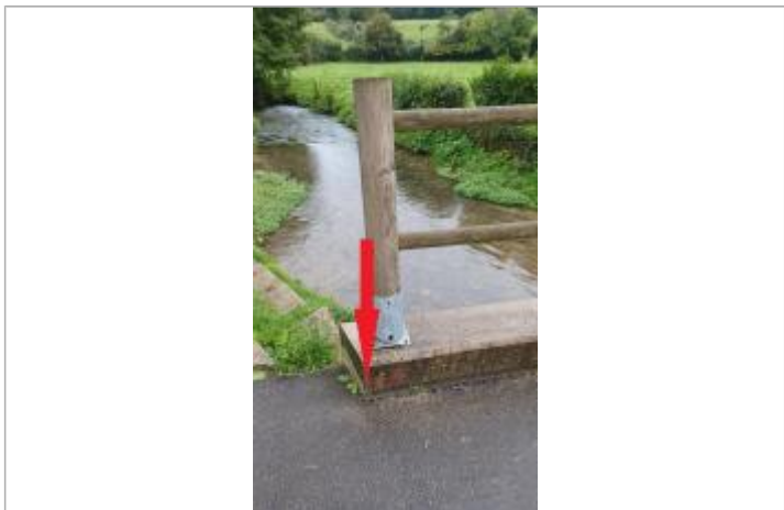
Vue du repère à 15 cm/sol

MARQUE Maximum de l'inondation : Oui Visibilité : Oui État du repère : Disparu Pérennité : Aucune