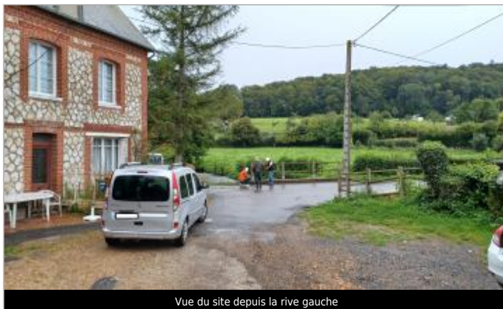
Vue du site depuis la rive gauche

GÉOLOCALISATION Coordonnées WGS84 : X: 0.30336499 / Y: 49.37735300 Coordonnées RGF93 (Lambert 93) : X: 504153.87 / Y: 6923104.32 Coordonnées RGF93 (ETRS89) : X: 0.303365 / Y: 49.377353 Code Hydro: H71-0400 Rive de référence: Gauche