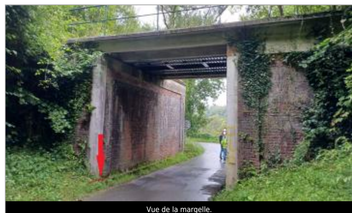
Vue de la margelle.