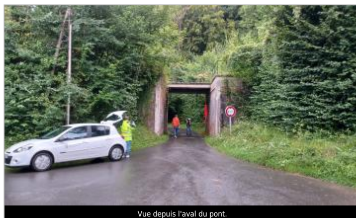
Vue depuis l'aval du pont.