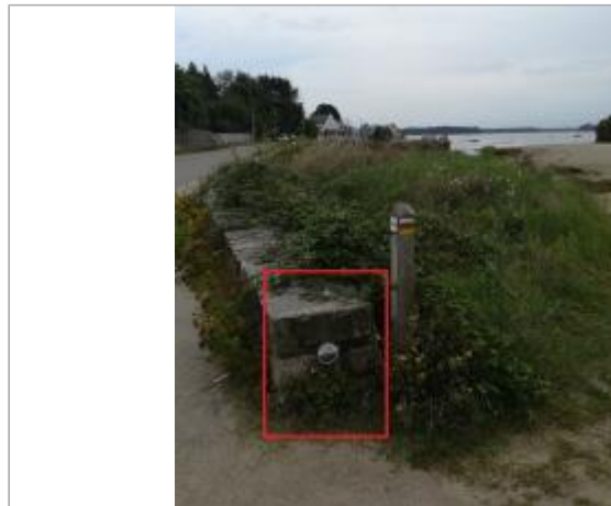
Muret route de Kerpenhir