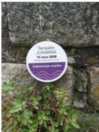
Repère normalisé de la tempête Johanna du 10 mars 2008