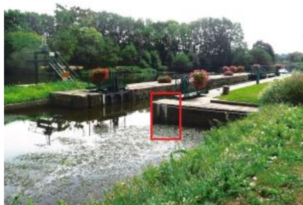
Ecluse de la Ville aux Fruglins amont au Val d'Oust