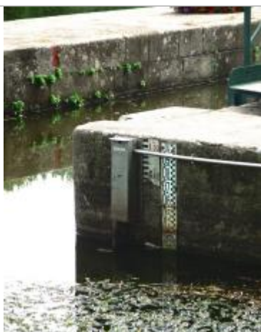
Ecluse amont de la Ville aux Fruglins au Val d'Oust

Altitude calculée de l'eau (en m) : 20.046 m