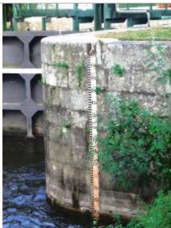
Echelle aval de l'écluse de Montertelot