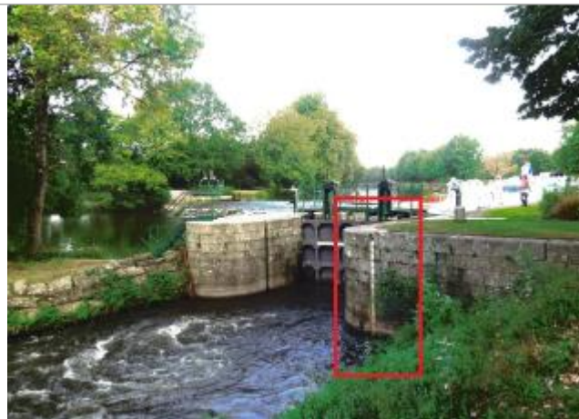
Ecluse de Montertelot aval