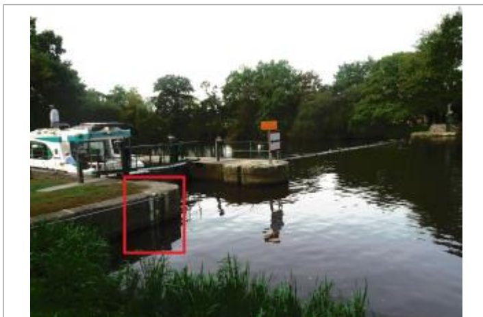
Ecluse de Montertelot amont