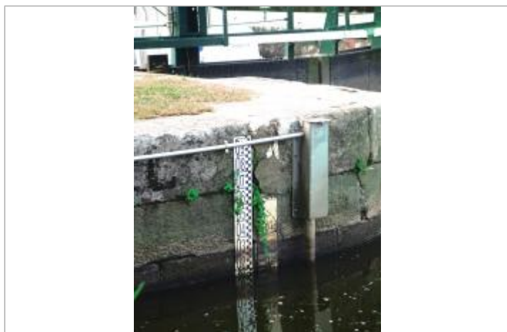
Echelle amont de l'écluse de Montertelot

Code : SPC_56139_01_1930 Date de mise à jour : 07/09/2023