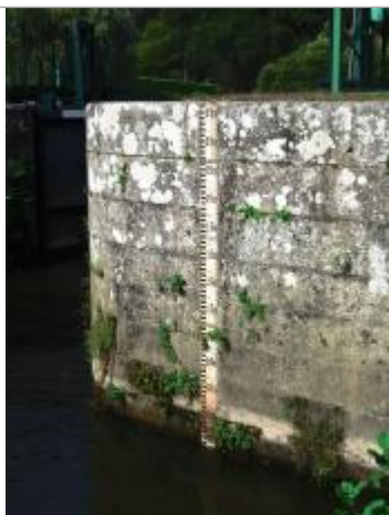
Echelle aval de l'écluse de Blon à Guillac

Altitude calculée de l'eau (en m) : 22.934 m