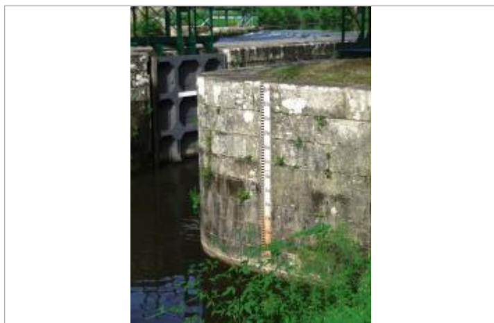
Echelle aval de l'écluse de Guillac

Altitude calculée de l'eau (en m) : 25.112 m