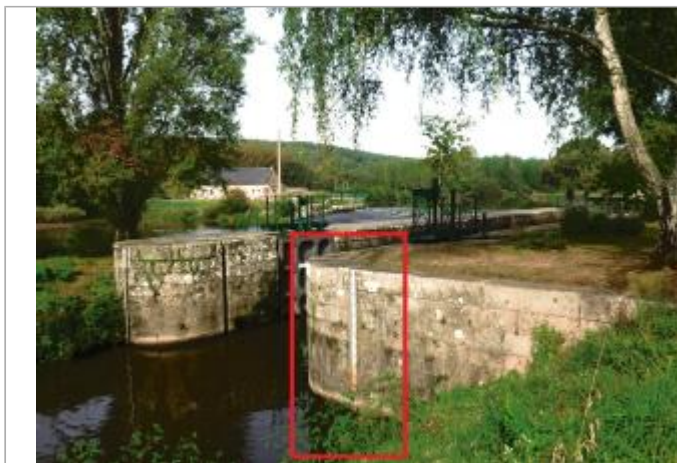
Ecluse de Guillac aval