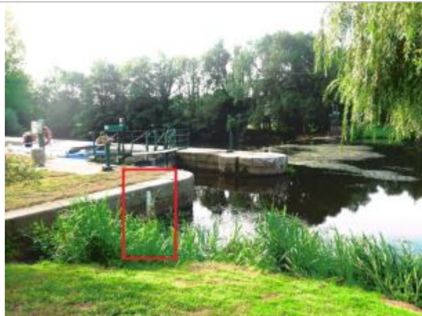
Ecluse de Clan amont à Guillac