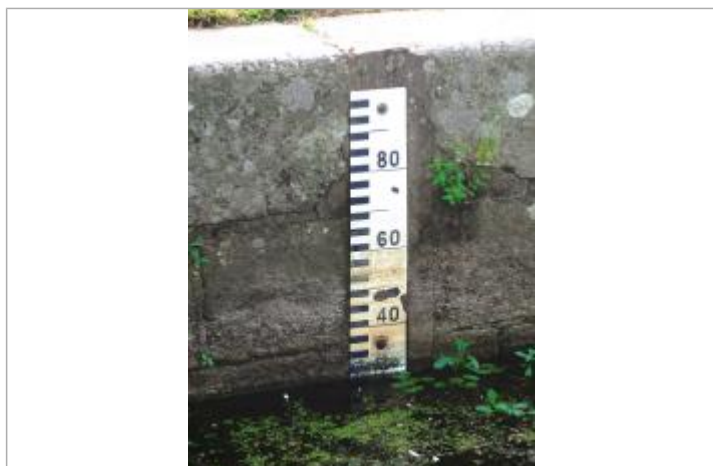
Echelle amont de l'écluse de Clan à Guillac

Altitude calculée de l'eau (en m) : 29.712 m