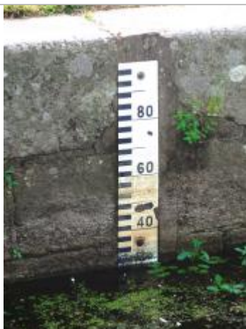
Echelle amont de l'écluse de Clan à Guillac