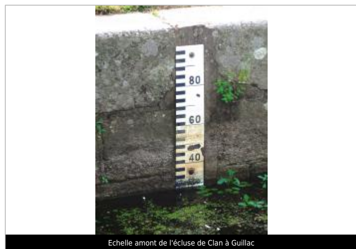
Echelle amont de l'écluse de Clan à Guillac

GÉNÉRAL Code : SPC_56079_03_1925 Date de mise à jour : 13/03/2025 Auteur : SPC VCB