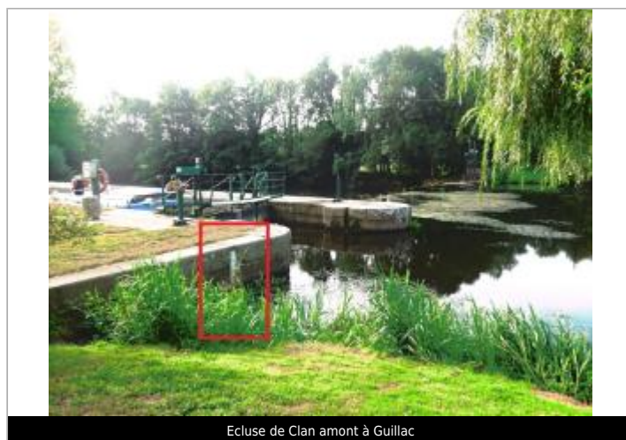
Ecluse de Clan amont à Guillac

GÉOLOCALISATION Coordonnées WGS84 : X: -2.51830795 / Y: 47.93106380 Coordonnées RGF93 (Lambert 93) X: 288246.88 / Y: 6773357.1 Coordonnées RGF93 (ETRS89) X: -2.518308 / Y: 47.9310638 Code Hydro: J8--0230 Rive de référence: Gauche