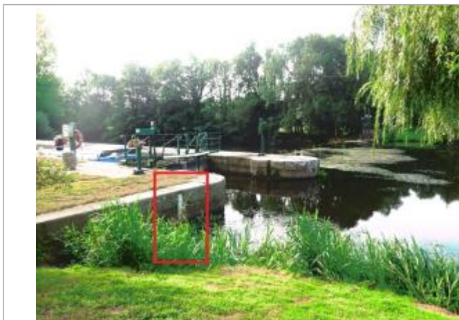
Ecluse de Clan amont à Guillac