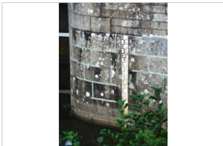
Echelle aval de l'écluse de Saint Jouan à Guillac