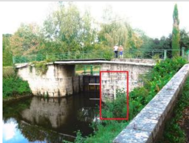
Ecluse de Saint Jouan aval à Guillac