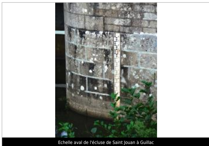
Echelle aval de l'écluse de Saint Jouan à Guillac

Altitude calculée de l'eau (en m) : 30.061