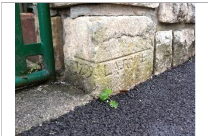
photo du repère

Texte : 1799 LA SONE Maximum de l'inondation : Oui Visibilité : Oui État du repère : Moyen Pérennité : Moyenne